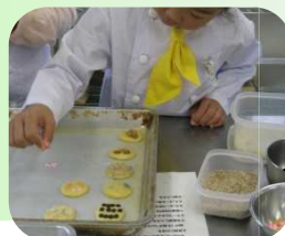
思い思いにトッピング！

イベントの秋は各地でお祭りが目白押し！ひかりも「名瀬ケアプラザ祭り」「第33回戸塚ふれあい区民祭り」「戸塚ふれあい文化祭」に展示・出展しました。