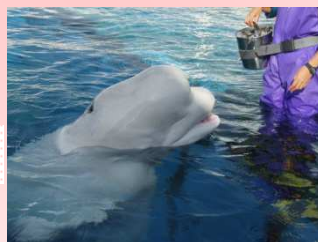
白イルカにも触ったよ♪

水槽清掃の方とパチリ。 沢山のおさかなや触れる 水槽を楽しみました。 (ナマコにも触ったよ♪)