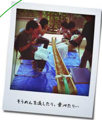
そうめんを流したり、食べたり...

暑～い、暑～い夏でした。 いろいろな場面で沢山の 思い出、できたかな？ 今回はポラロイド風で思い出 アルバムです。