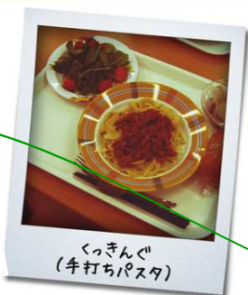
くっきんぐ (牛打ちパスタ)