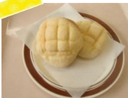
第1位 チョコチップメロパン