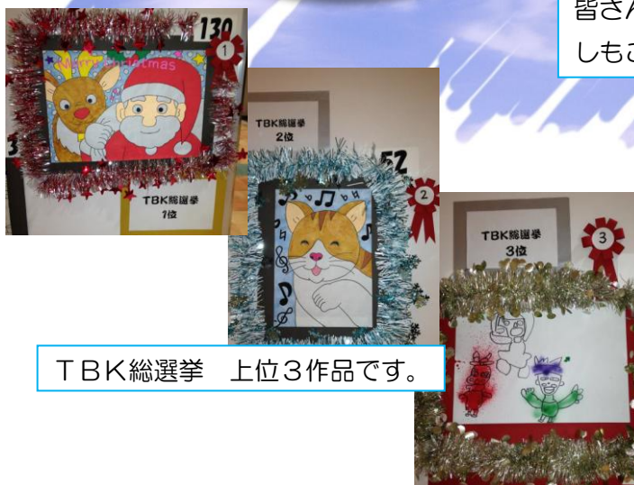
TBK総選挙 上位3作品です。

今回のタペストリーは「戸塚障害者地域活動ホームしもごう」の皆さんと一緒に作成しました！ しもごうとひかりのコラボレーション!!